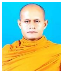
พระศรีธรรมประสาธน์

ที่ปรึกษาเจ้าคณะจังหวัดพัทลุง เจ้าอาวาสวัดอินทราวาส