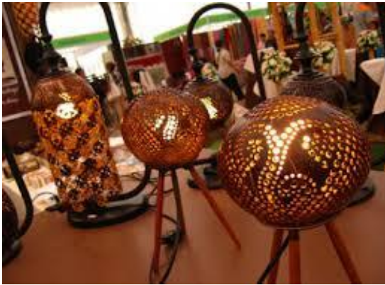
ข้าวสังข์หยด