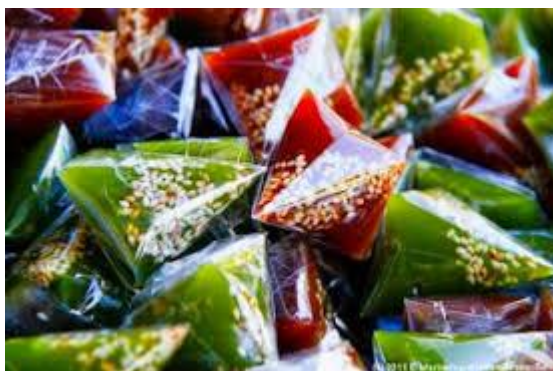
กะละแมนางลาด