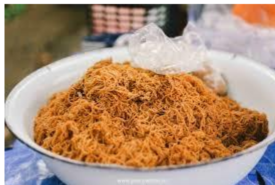
บ๊องดำนาหน