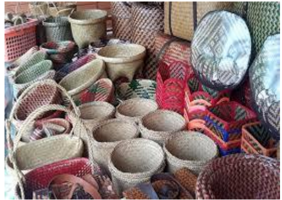
ลูกหยีสามรส