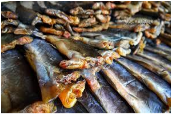
ผลิตภัณฑ์กะลา