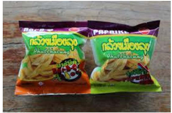
ผลิตภัณฑ์กระจุต