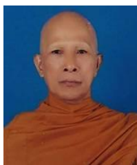
พระเทพปริยัติคุณ

ที่ปรึกษาเจ้าคณะภาค 18 เจ้าอาวาสวัดคูหาสวรรค์ พระอารามหลวง