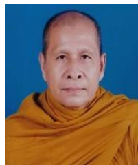
พระศรีปัญญาจารย์

ที่ปรึกษาเจ้าคณะภาค 18 ผู้ช่วยเจ้าอาวาสวัดคูหาสวรรค์ พระอารามหลวง